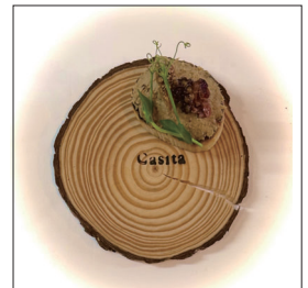
ポークリエット Pork rillettes