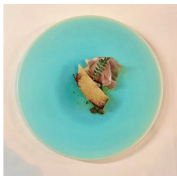
タケノコの 発酵バター焼き Bamboo shoots