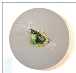
グリーンアスパラと ケールのリゾット Seasonal Vegetable Risotto