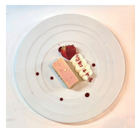
苺のティラミス Strawberry Tiramisu