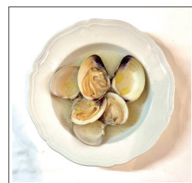
地ハマグリ の白ワイン蒸し Japanese hard clam