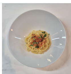
桜エビのアーリオオーリオ Sakura Shrimp Aglio e Olio