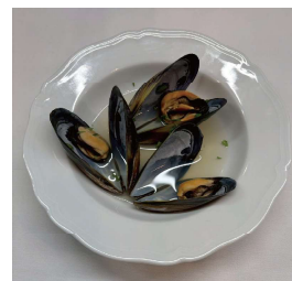
青森県産 ムール貝のワイン蒸し Steamed mussels