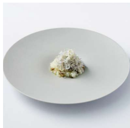
釜揚げしらすりゾット Whitebait Risotto