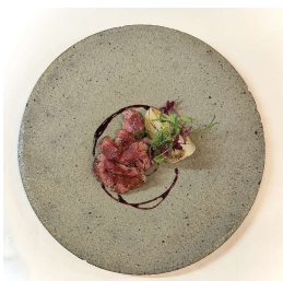
北海道 宗谷黒牛 リブローズ Japanese Beef Rib eye