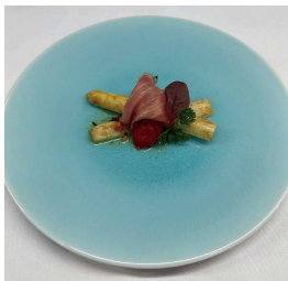
ホワイトアスパラガス White asparagus