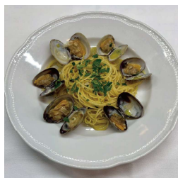
厳選あさりの ボンゴレビアンコ Vongole Bianco