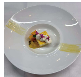
パッションマンゴーの ティラミス Passion Mango Tiramisu