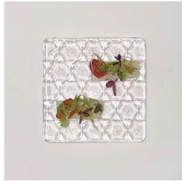
鮮魚のカルパッチョ Carpaccio