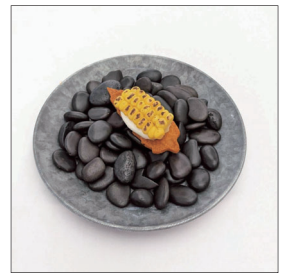
玉蜀黍のタルト Corn Tart