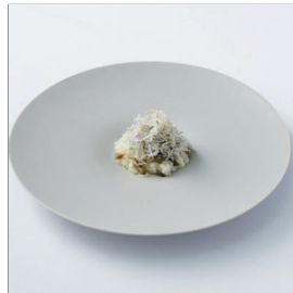
アスパラガスとチーズのリゾット Asparagus & Cheese Risotto