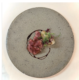
北海道 宗谷黒牛 リブロース Japanese Beef Rib eye