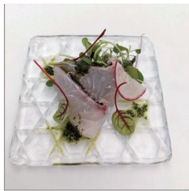
鮮魚のカルパッチョ Carpaccio