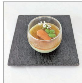
枝豆のブランマンジェ Blancmange