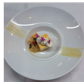
パッションマンゴーの ティラミス Passion Mango Tiramisu