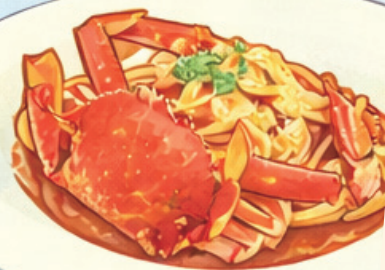
渡り蟹の トマトソース リングイネ 3,500yen (3,850 tax-in)