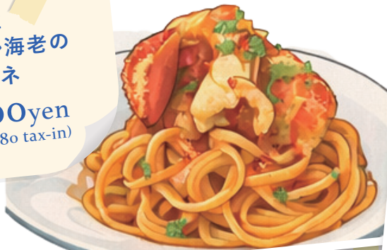
カナダ産 オマール海老の リングイネ 3,800yen (4,180 tax-in)