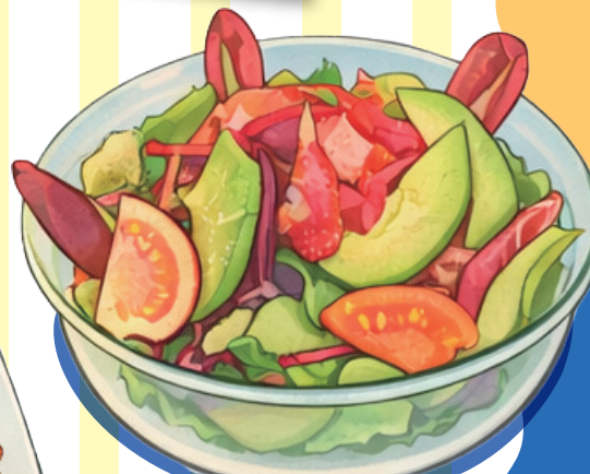
蟹とアボカドのグリーンサラダ -レモンドレッシング- 2,800yen (3,080 tax-in)