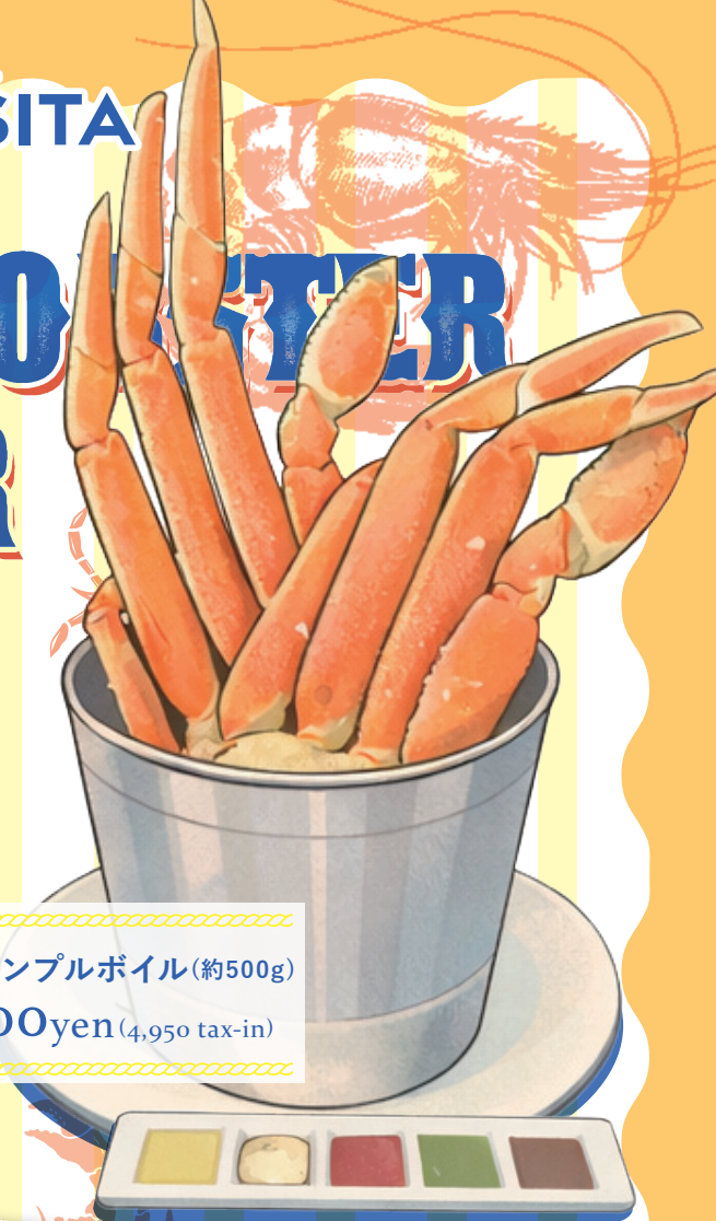
蟹のシンプルボイル(約500g) 4,500yen (4,950 tax-in)