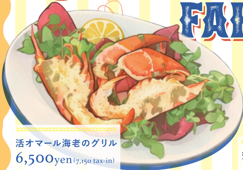
活オマール海老のグリル 6,500yen (7,150 tax-in)